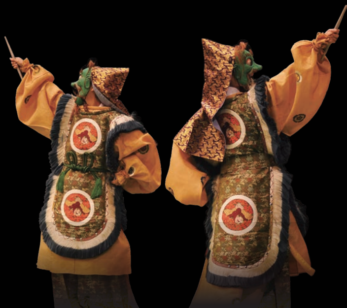
納曽利（二人舞）

今回は「雅楽の試みと鑑賞」と題し、西洋楽器を用いた雅楽編曲と古楽譜に基づく笙付き高麗楽の演奏という二つの新規的試みにより、雅楽の音楽的な可能性を探ります。